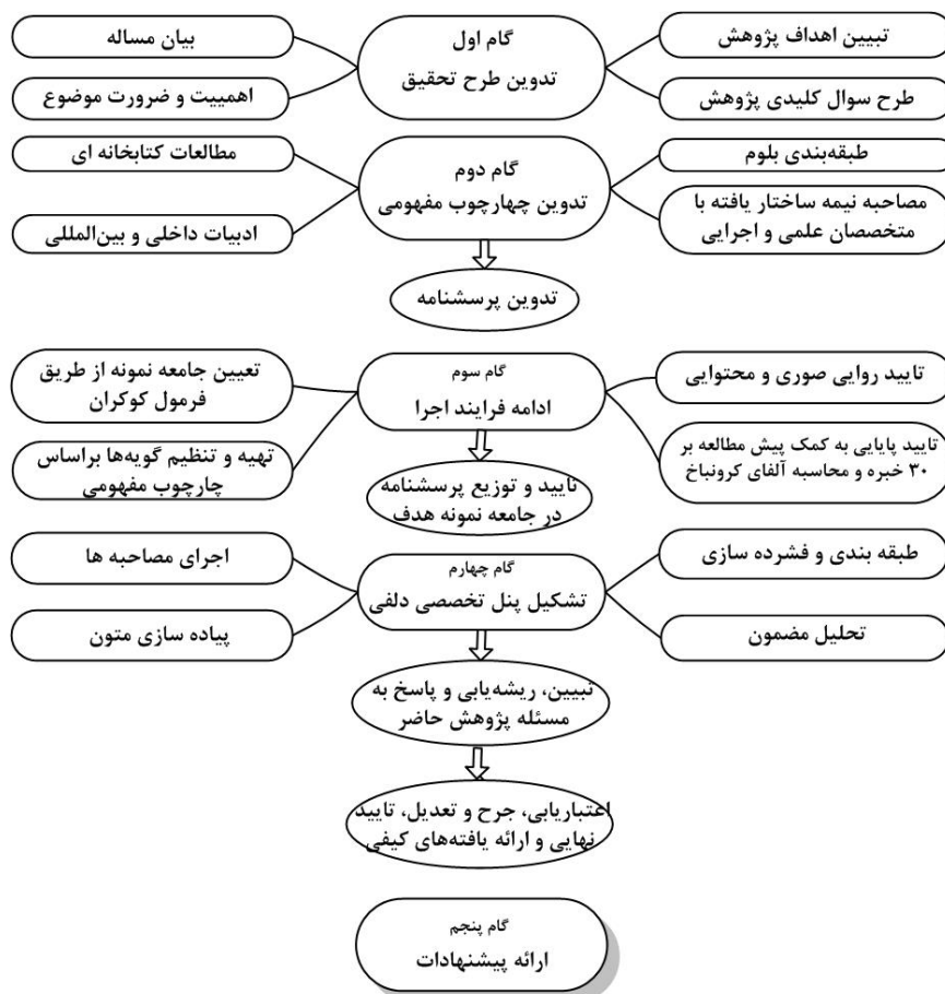
شکل (۱): مدل مفهومی اجرای پژوهش