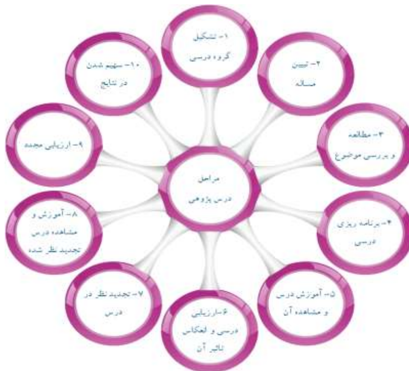
نمودار (۲): چرخه درس پژوهی (Mahmoudi Far, 2016)

- نحوه اجرای طرح درس علوم با رویکرد درس پژوهی: ۱- تشکیل گروه درسی مدارس گروه آزمایش: در هر مدرسه گروه درس پژوهی که شامل: سه دبیر علوم پایه هشتم، مدیر، معاون آموزشی، فیلم بردار می باشد را تشکیل داده. ۲- تبیین مسأله: مسأله مورد نظر که در جلسه هم اندیشی کل معلمان طبق جدول (۲) تعیین گردید بررسی و طبق برنامه زمان بندی شده تبیین گردید. ۳- مطالعه و بررسی موضوع: گروه درس پژوهی در هر مدرسه موضوع را بررسی نموده و موارد مربوط به فرآیند تدریس و کج فهمی احتمالی دانش آموزان مدرسه مربوطه را بررسی نمود. ۴- برنامه ریزی درسی: گروه درس پژوهی مبادرت به تهیه طرح درس با توجه به مسأله مطرح شده نموده، در طرح درس مذکور دبیر تدریس کننده مبحث و همچنین وظایف افراد تیم درس پژوهی مشخص گردید. ۵- آموزش درس و مشاهده آن: طرح درس نوشته شده توسط دبیر داوطلب که از قبل مشخص شده است در دو کلاس پایه هشتم اجرا می گردد، دیگر اعضای گروه درس پژوهی که شامل: دو دبیر دیگر کلاس پایه هشتم، مدیر مدرسه، معاون آموزشی، فیلم بردار و دیگر اعضای داوطلب (والدین، دیگر دبیران) در اولین جلسه اجرا طرح درس با رویکرد درس پژوهی شرکت کردند. ۶- ارزیابی درسی و انعکاس تأثیر آن: دبیر مربوطه طبق طرح درس مشخص شده مبحث را تدریس نموده دیگر اعضا گروه درس پژوهی شامل دبیران گروه درس پژوهی در حین تدریس همکار خود، با رفتن بر سر میز